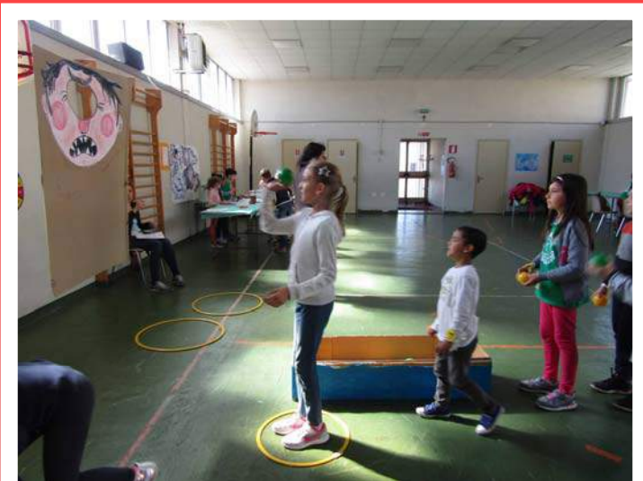
Polifemo: Tiro a segno