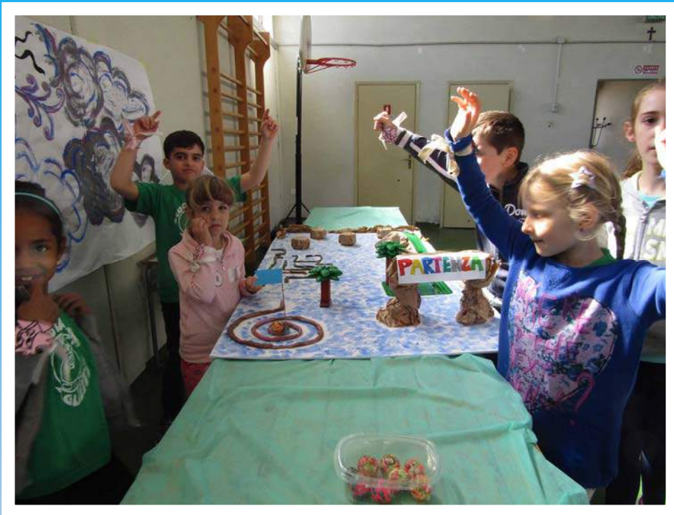
Eolo, re dei venti: percorso del soffio