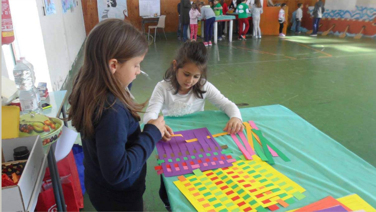
PENELOPE: LA TESSITURA