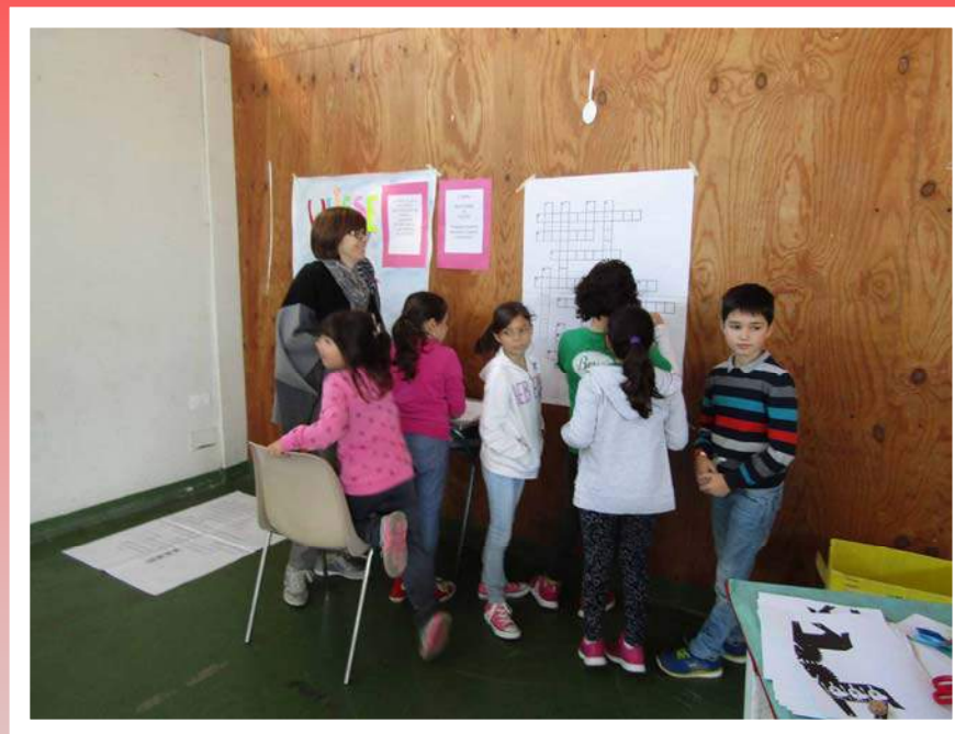
Cruciverba di Ulisse